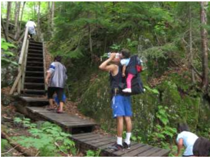
Parc Aiguebelle - 21 juillet 21 participants