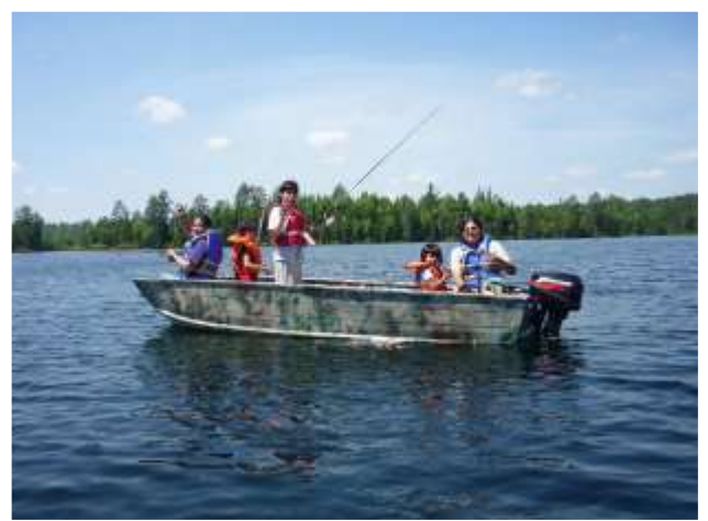
Activité de pêche - 19 juillet 18 participants